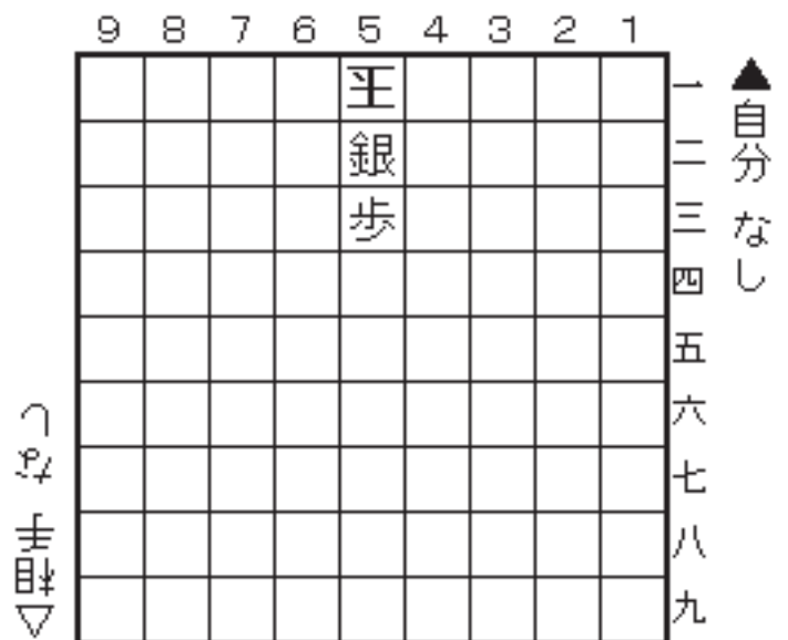
【 2図 】